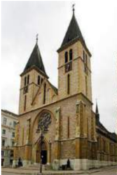
Sacred Heart Cathedral Herz-Jesu-Kathedrale

Das alte Rauthaus im pseudomaurischen Stil