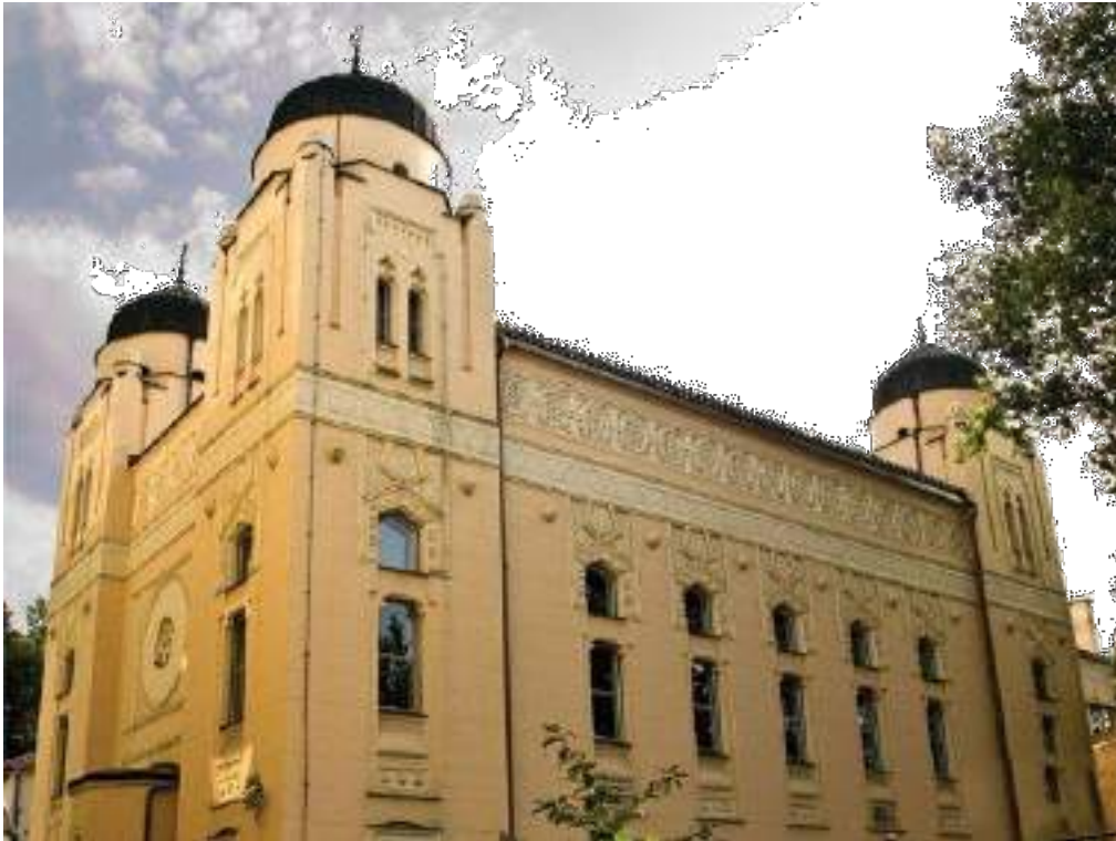
The Ashkenazi Synagogue Synagoge der Aschkenasim