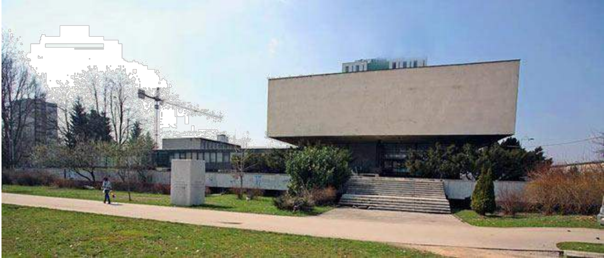
The History Museum