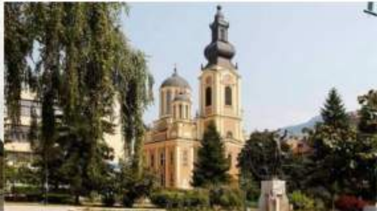
The Church of the Nativity of the Theotokos orthodoxe Kathedrale