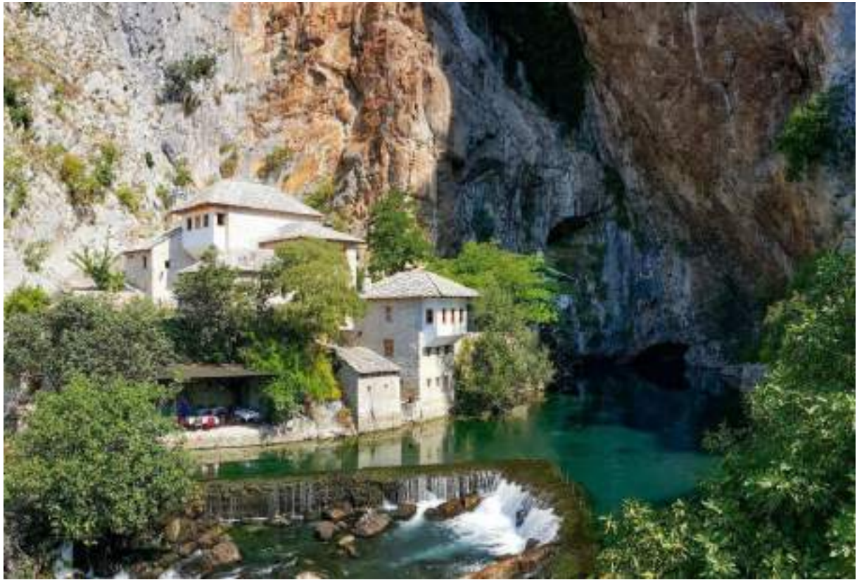
The Dervish house