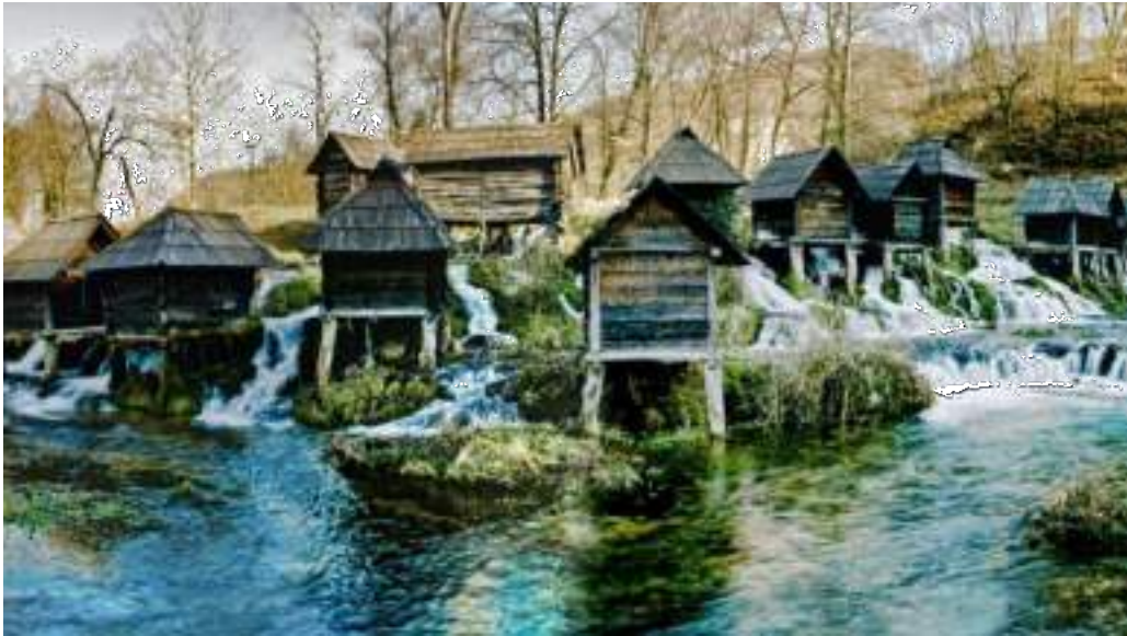
Jajce- the town of rivers and lakes Jajce – die Stadt der Flüsse und Seen