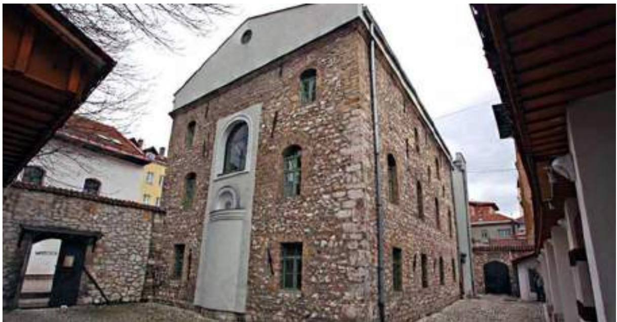
The Old Synagogue/The Museum of the Jews of Bosnia and Herzegovina Alte Synagoge/ Jüdisches Museum