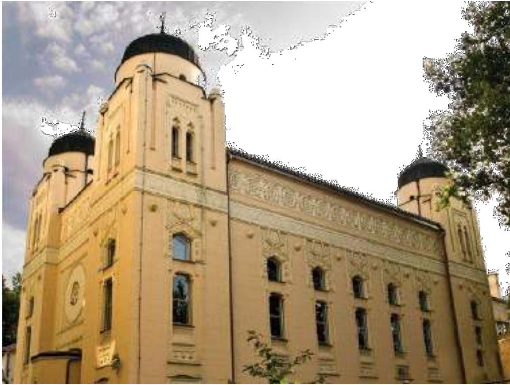
The Ashkenazi Synagogue Synagoge der Aschkenasim