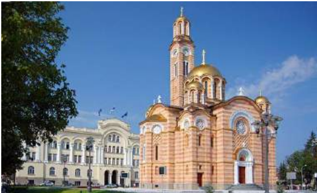
Temple of Christ the Saviour