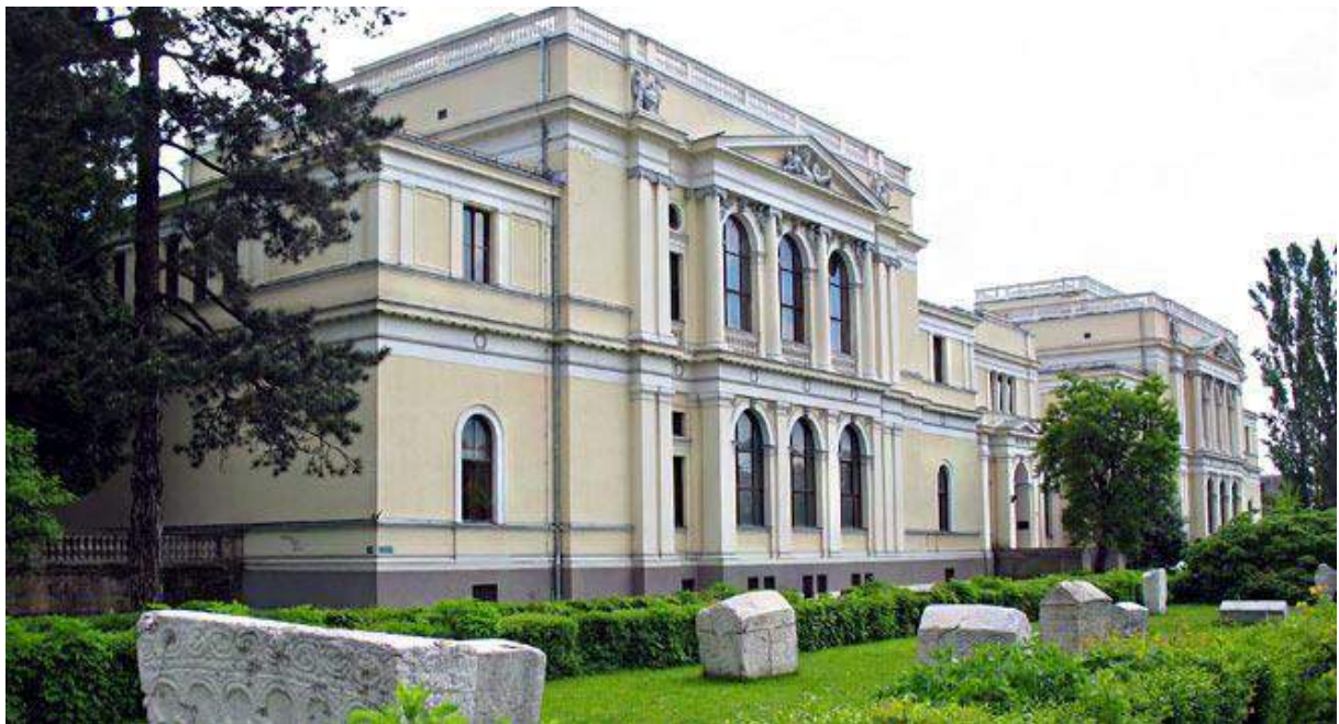
The National Museum

Das namengebende Gebäude des Stadtviertels Marindvor (Marienhof)