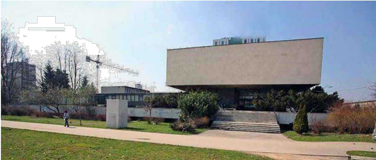
The History Museum