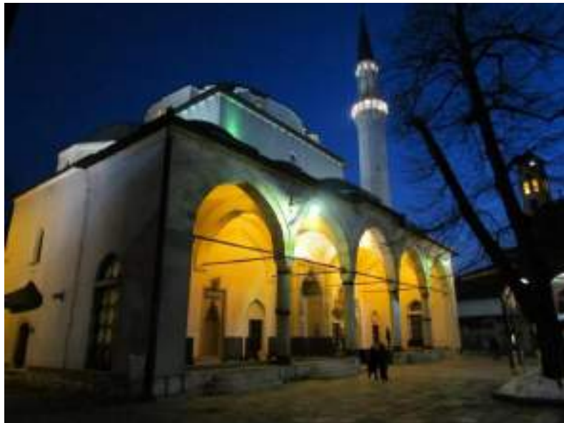
Gazi Husref-bey's Mosque, Baščaršija Gazi Husref-Beg's Moschee