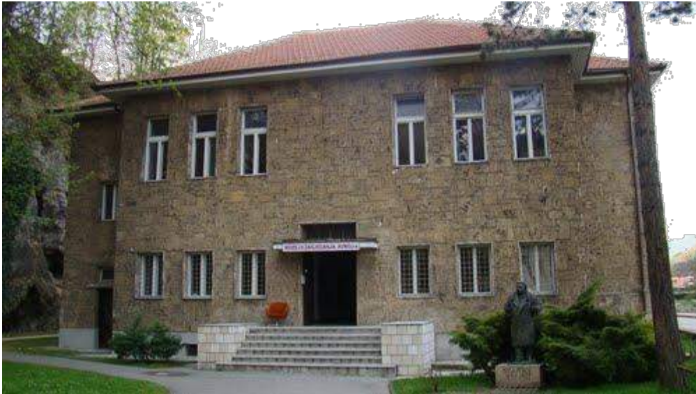
The AVNOJ Museum