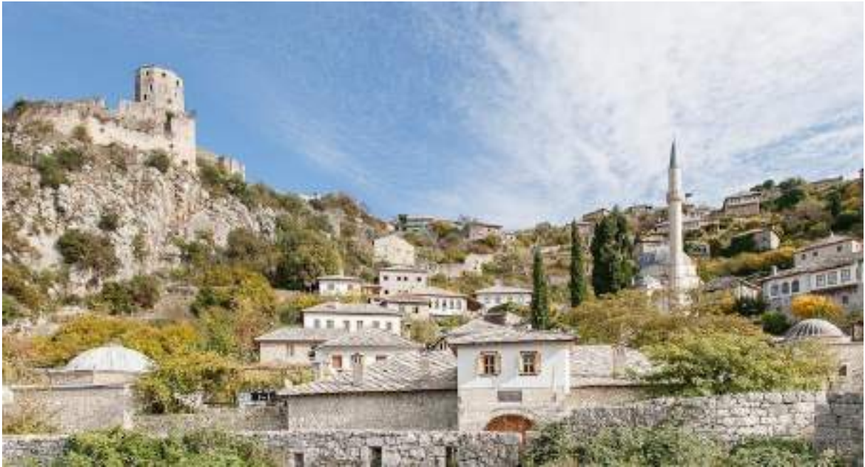
The Old Town and the Fortress – south of Mostar Alte