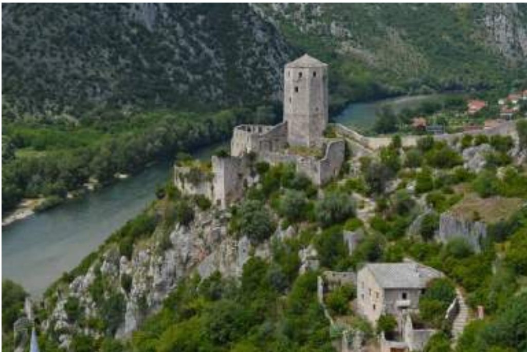
Počitelj on the Neretva