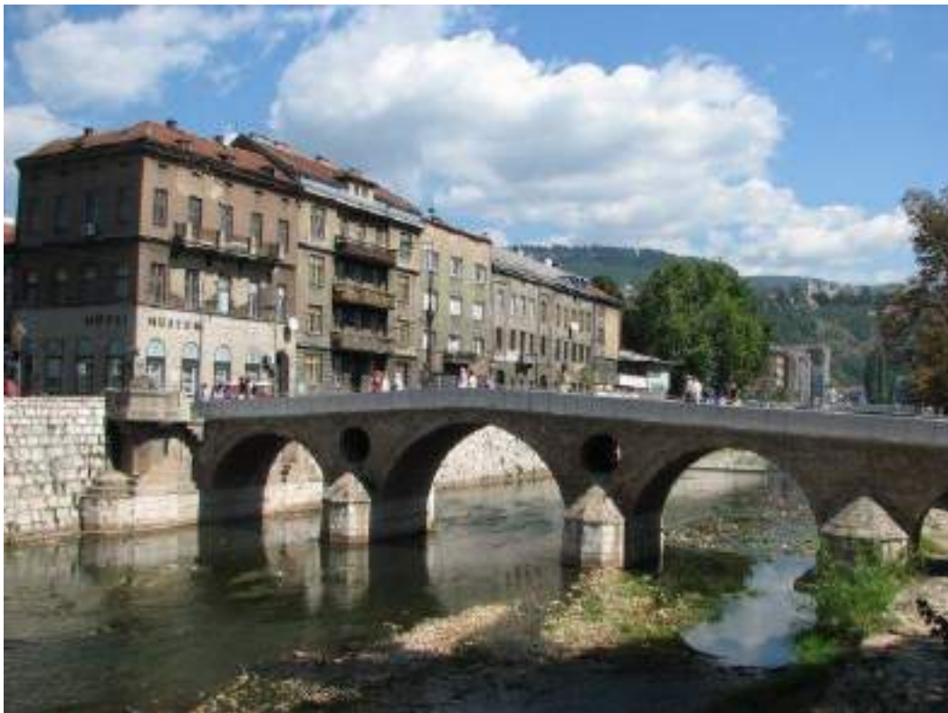
Latin Bridge and the Museum of Sarajevo