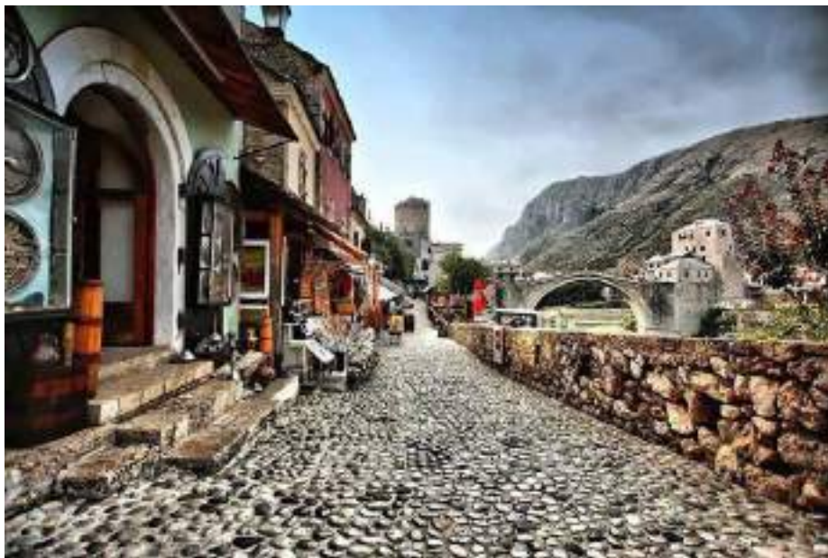
Altstadt von Mostar