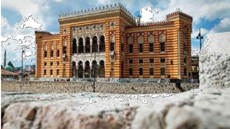
Sarajevo City Hall