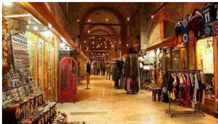
Gazi Husref-bey's bezistan (the old market) / Gazi Husref-Beg's Bezistan