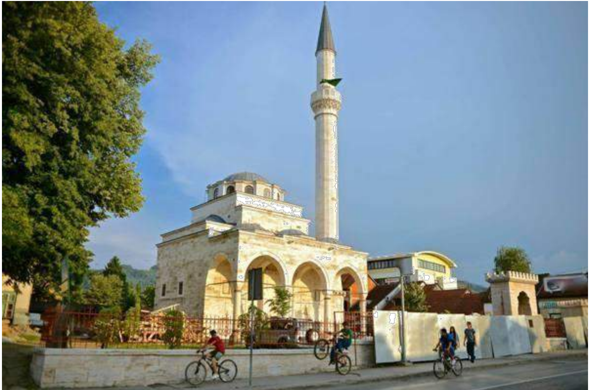
The Ferhadija mosque in Banja Luka