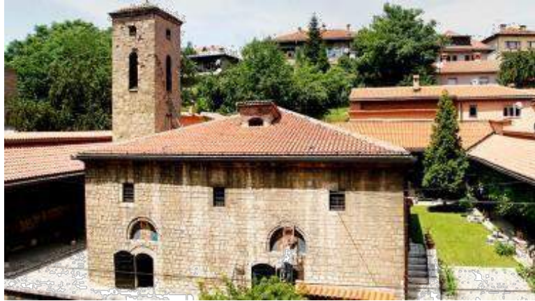
The Old Orthodox Church in Sarajevo Alte orthodoxe Kirche