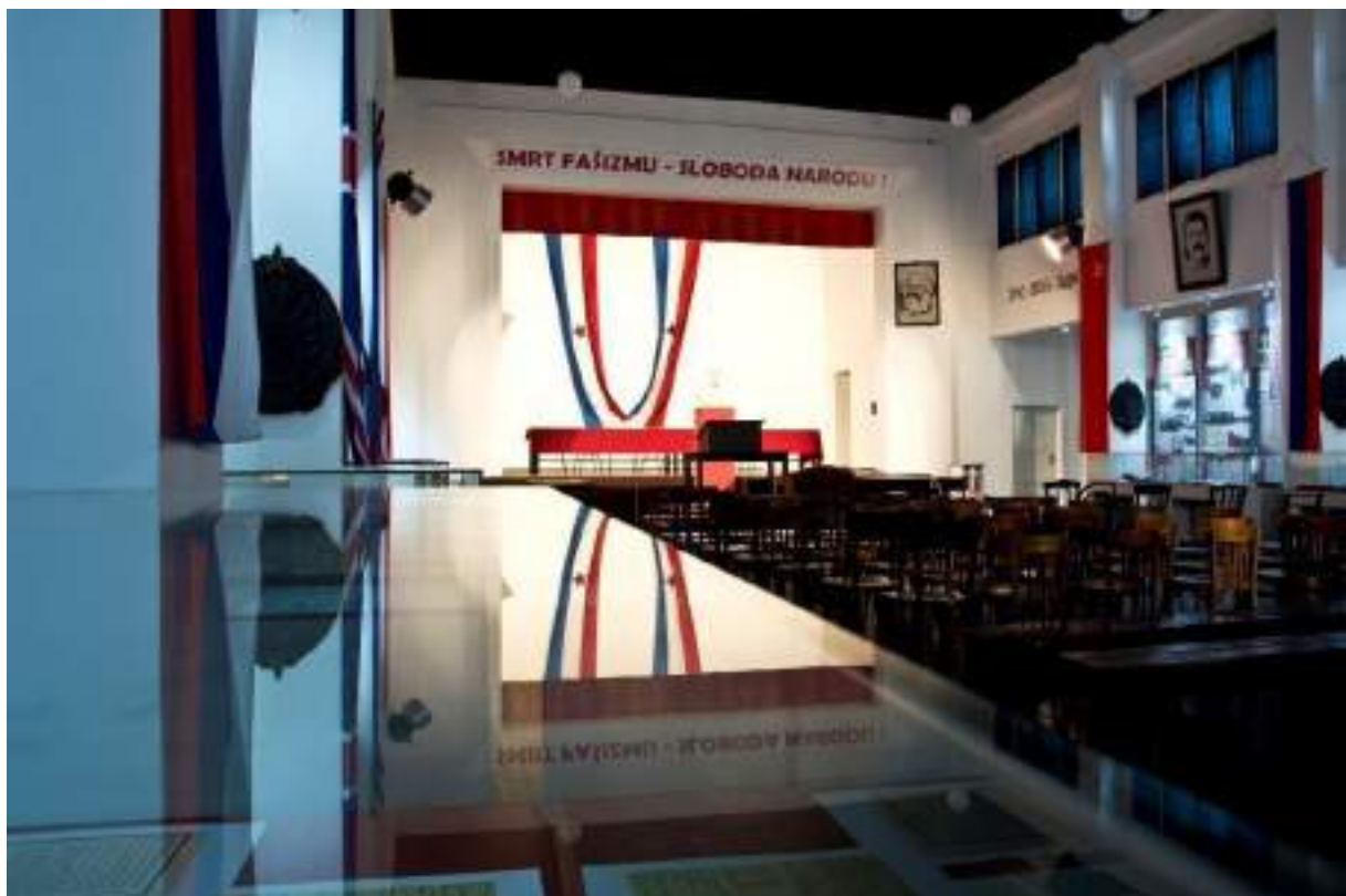
The birthplace of Tito's Yugoslavia