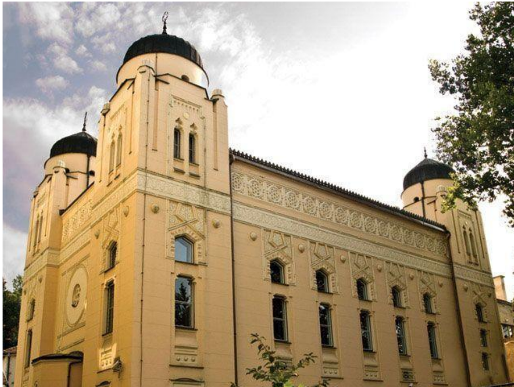
The Ashkenazi Synagogue Synagoge der Aschkenasim