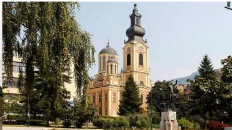
The Church of the Nativity of the Theotokos orthodoxe Kathedrale