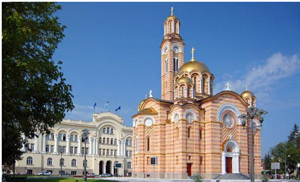
Temple of Christ the Saviour