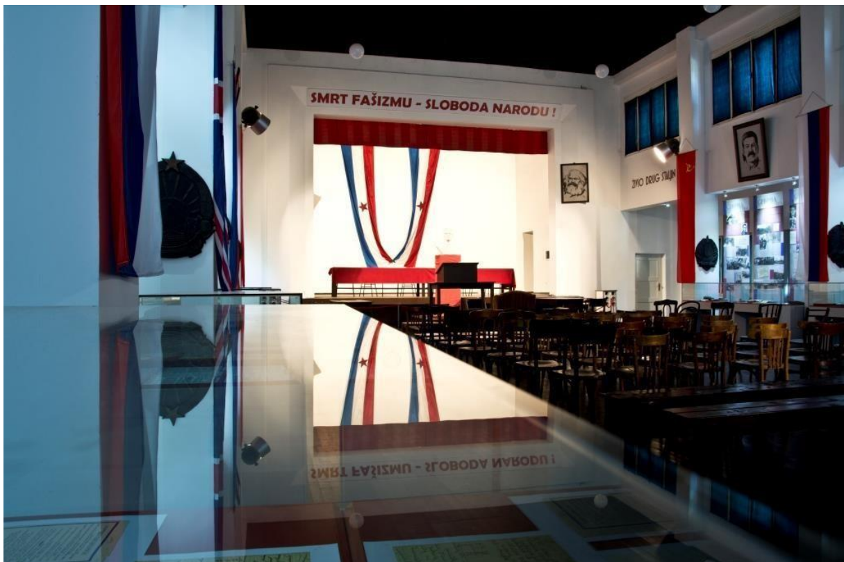
The birthplace of Tito's Yugoslavia Der Geburtsort von Titos Jugoslawien