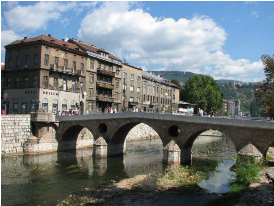
Latin Bridge and the Museum of Sarajevo Lateinische Brücke und Museum