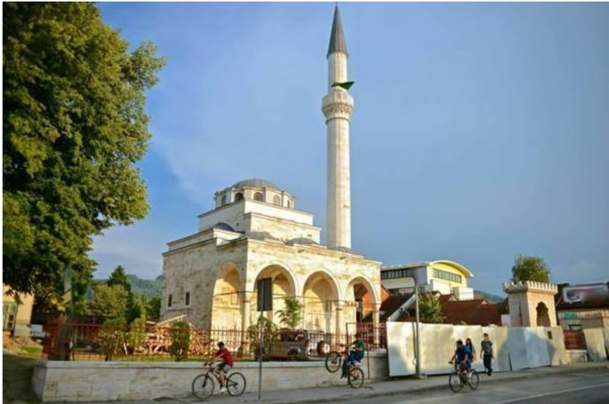
The Ferhadija mosque in Banja Luka