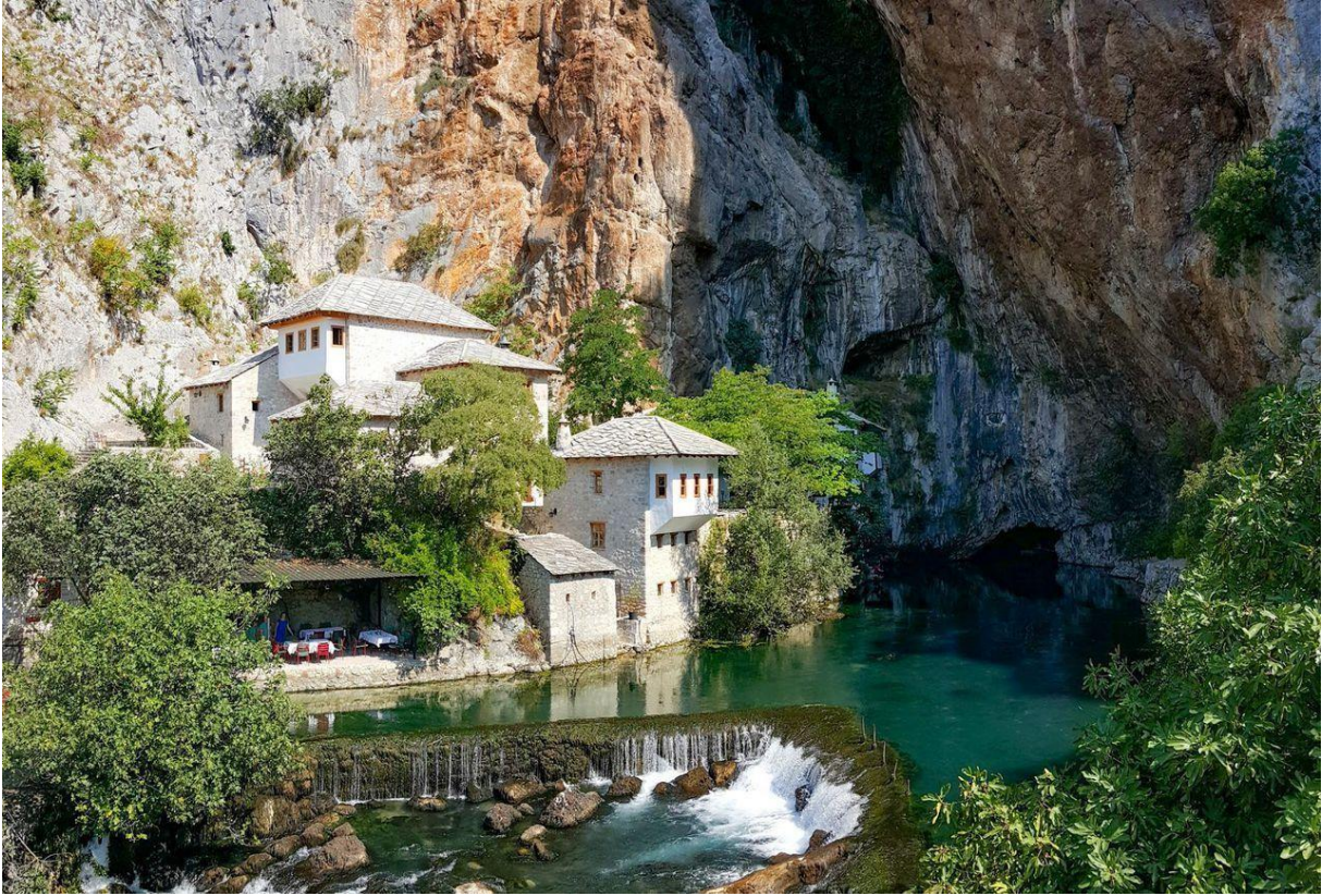
The Dervish house Derwischenhaus