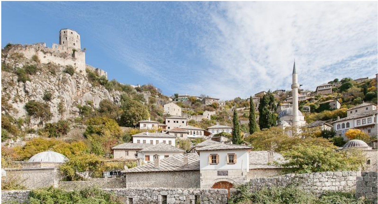
The Old Town and the Fortress – south of Mostar

Alte Stadt mit Festung – südlich von Mostar