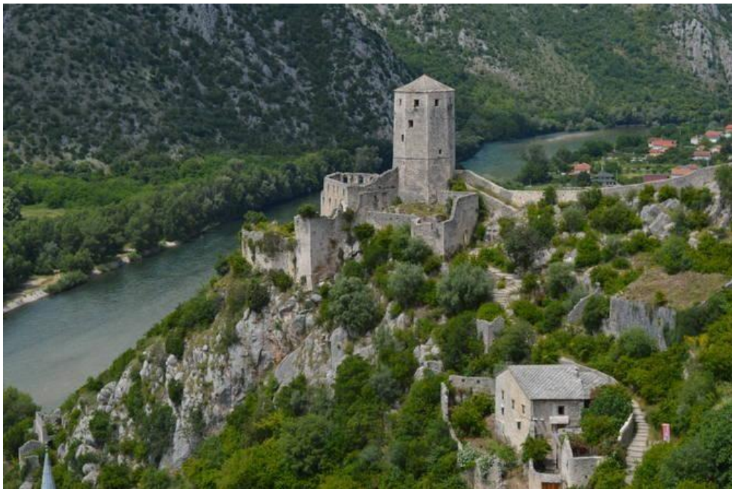
Počitelj on the Neretva

Alte Stadt mit Festung – südlich von Mostar