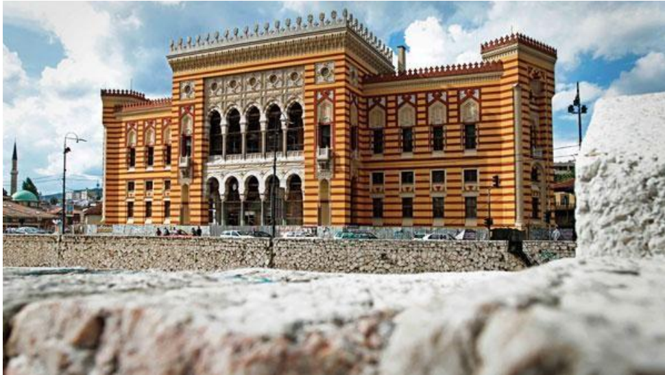
Sarajevo City Hall