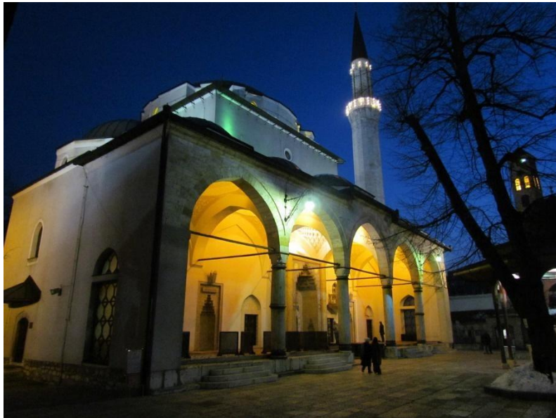
Gazi Husref-bey's Mosque, Baščaršija