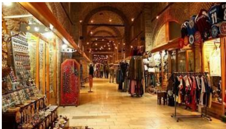
Gazi Husref-bey's bezistan (the old market) / Gazi Husref-Beg's Bezistan