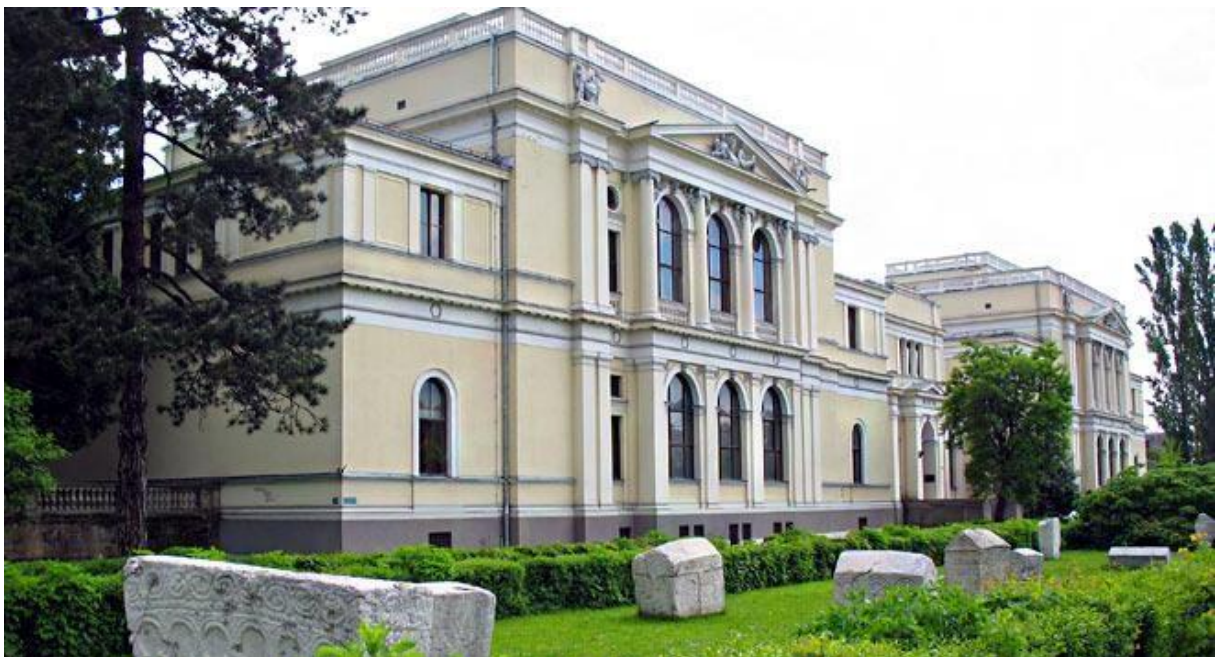
The National Museum

Das namengebende Gebäude des Stadtviertels Marindvor (Marienhof)