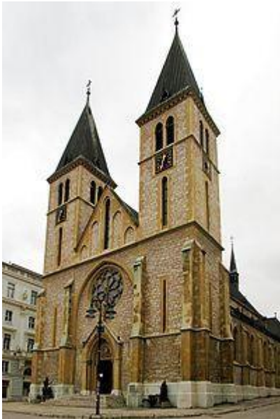
Sacred Heart Cathedral Herz-Jesu-Kathedrale

Das alte Rauthaus im pseudomaurischen Stil