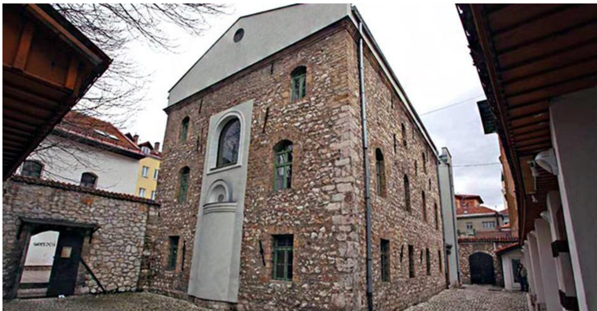
The Old Synagogue/The Museum of the Jews of Bosnia and Herzegovina Alte Synagoge/ Jüdisches Museum