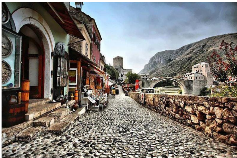
Altstadt von Mostar