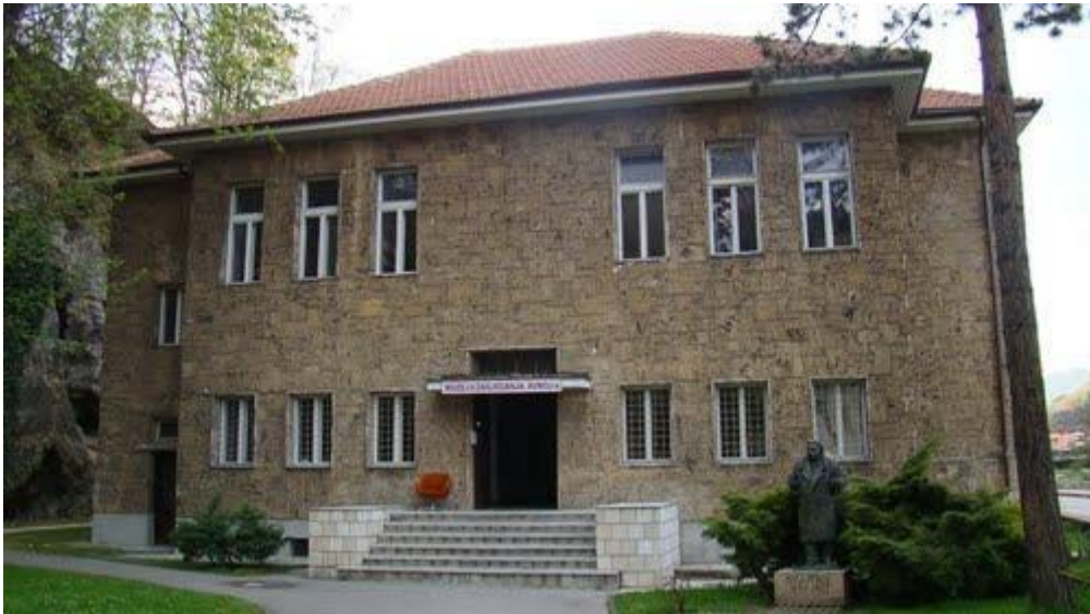
The AVNOJ Museum AVNOJ Museum