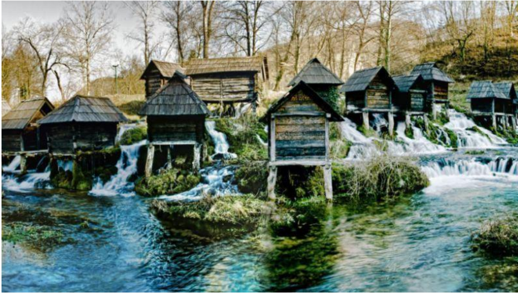
Jajce- the town of rivers and lakes Jajce – die Stadt der Flüsse und Seen