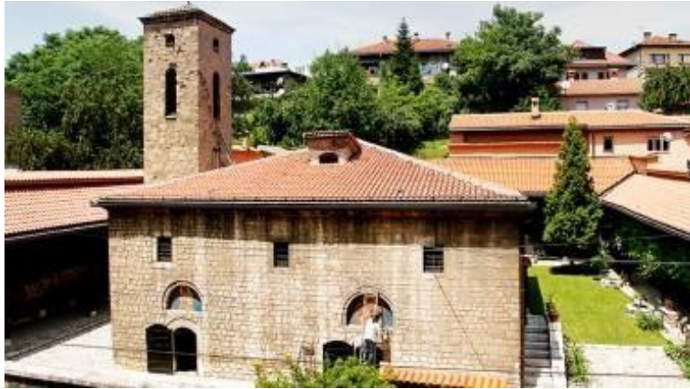
The Old Orthodox Church in Sarajevo