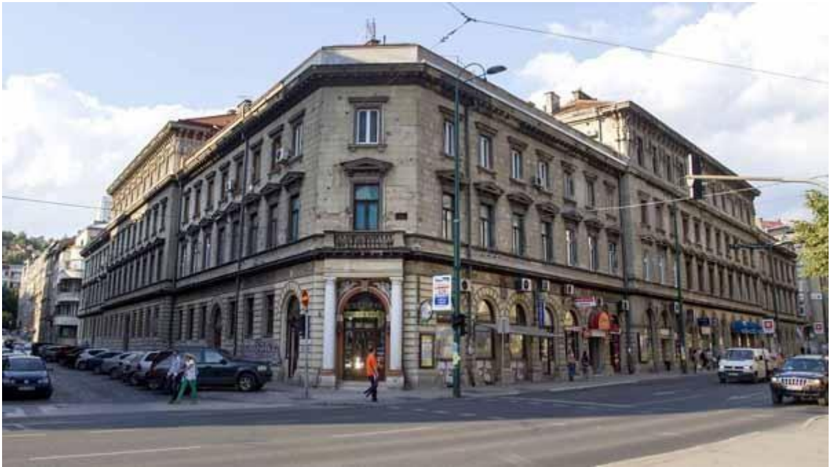
Marijin dvor (Maria's Yard)

Das namengebende Gebäude des Stadtviertels Marindvor (Marienhof)