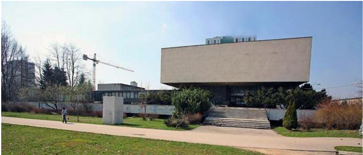
The History Museum Historisches Museum